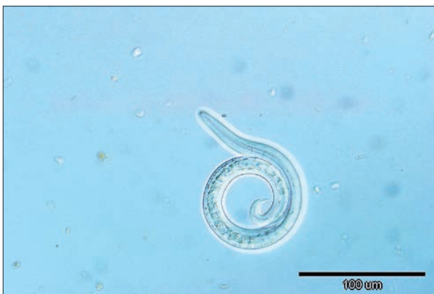
Ryc. 1. Larwa L1 A. vasorum z charakterystycznym zakończeniem ogona

Dla lekarzy zajmujących się diagnostyką i leczeniem psów w Europie, największe znaczenie ma gatunek Angiostrongylus vasorum , którego postaci dorosłe lokalizują się w naczyniach krwionośnych, głównie tętnicach płucnych oraz prawej komorze serca. Nicienie te z uwagi na hematofagię charakteryzują się krwistoczerwoną barwą. Samice są większe od samców, osiągają do 2,5 cm długości. Jasna pętla macicy kontrastuje z czerwoną barwą jelita wypełnionego krwią, dając efekt dwukolorowego robaka. Samce długości 14–18 mm są jednobarwne, a w odcinku ogonowym mają charakterystyczną torebkę kopulacyjną i długie szczecinki kopulacyjne. Poza dojrzałymi nicieniami na uwagę zasługuje również morfologia larw L1, stwierdzanych w śluzie dróg oddechowych, płwocinie lub w kale zarażonych zwierząt. Larwy te mierzą około 310–400 µm długości i mają w grzbietowym odcinku ogona charakterystyczny kolec (ryc. 1, 2). Te szczegółowe morfologiczne pozwalają na identyfikację i odróżnienie Angiostrongylus vasorum od form rozwojowych innych gatunków nicieni obecnych w kale lub płwocinie psowatych (9, 10, 11, 12).