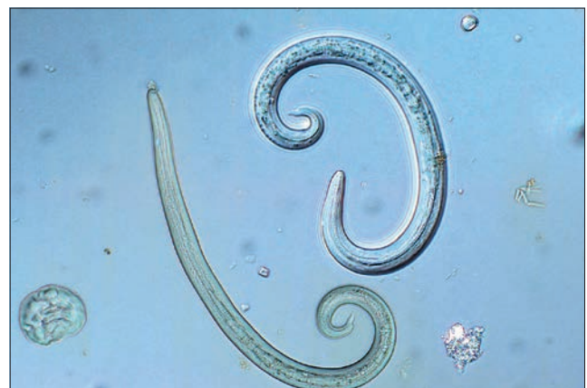
Ryc. 2. Morfologia larw L1 A. vasorum