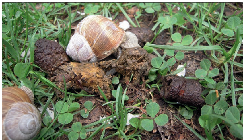
Ryc. 3. Dwa ślimaki winniczki ( Helix pomatia ) żerujące na odchodach psa. Możliwa droga zarażenia żywiciela pośredniego

Dojrzałe samice lokalizujące się w tętnicy płucnej żywicieli ostatecznych, po zapłodnieniu składają jaja, które z prądem krwi docierają do kapilar płucnych. W tych warunkach odbywa się wyklucie larw z jaj. Larwy uzbrojone w kolec perforują ścianę pęcherzyków płucnych, a następnie przenikają do światła oskrzelików. Z tym etapem cyklu związane są objawy kliniczne ze strony układu oddechowego. Larwy L1 obecne w śluzie dróg oddechowych są wydalane do środowiska zewnętrznego wraz z płwociną lub, co zdarza się znacznie częściej, są połykane i z treścią pokarmową wydalane są z kałem. Wydalanie larw może przebiegać nieregularnie. Ślimaki, żerując na kale zarażonych zwierząt, prawdopodobnie zjadają inwazyjne larwy L1. W ślimakach larwy te przechodzą dalsze przeobrażenia, kolejne linienia i po około 3 tygodniach osiągają postać inwazyjną dla żywiciela ostatecznego – larwy L3. Taki przebieg cyklu rozwojowego klasyfikuje je jako biohelminty (ryc. 4). Biorąc pod uwagę, że ślimaki żyją do kilku lat, można zakładać, że inwazyjne larwy ulokowane w cystach również przez długi czas